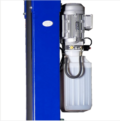
Kwaliteits hydrauliek pomp