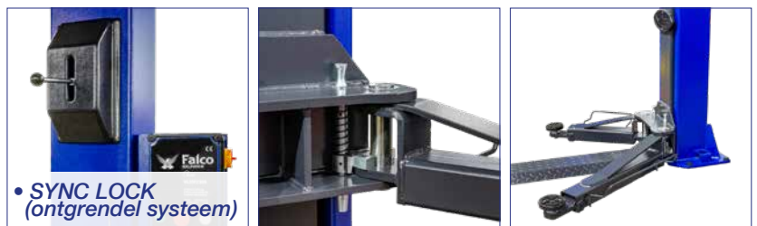
• SYNC LOCK (ontgrendel systeem)